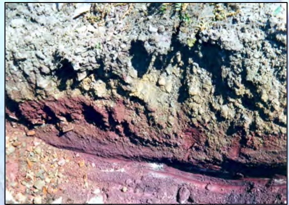
Ouverture de fosse à la pelle mécanique