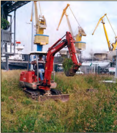
Recherche de pollution